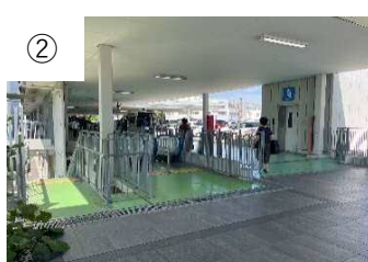
② エスカレーターで地上階へ