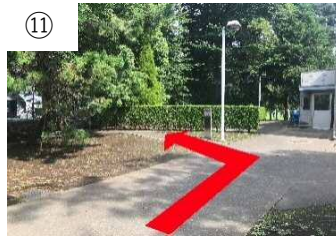
⑪ 正面の縦看板を左折