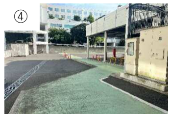
④ 緑の歩行路に沿って進む