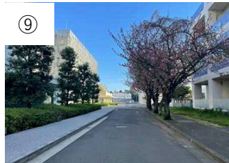
⑨ A1・A2号館の間を直進