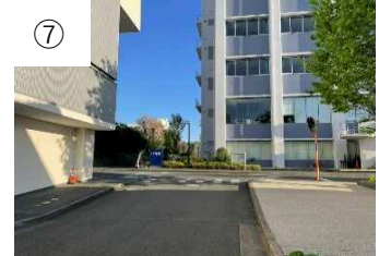
⑦ 正面のL1号館を左折