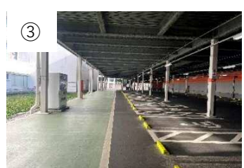
③ 緑の歩行路を直進